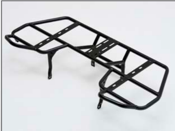
GEPÄCKTRÄGER VORNE DINLI 800 EVO