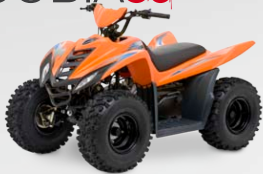
DINLI COBIA 50