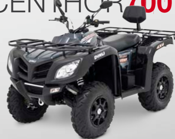
DINLI CENTHOR 700