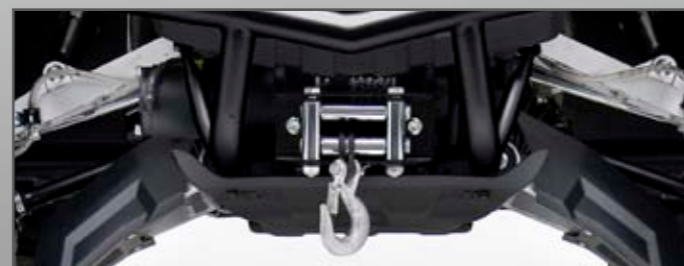
SEILWINDE MIT NYLONSEIL