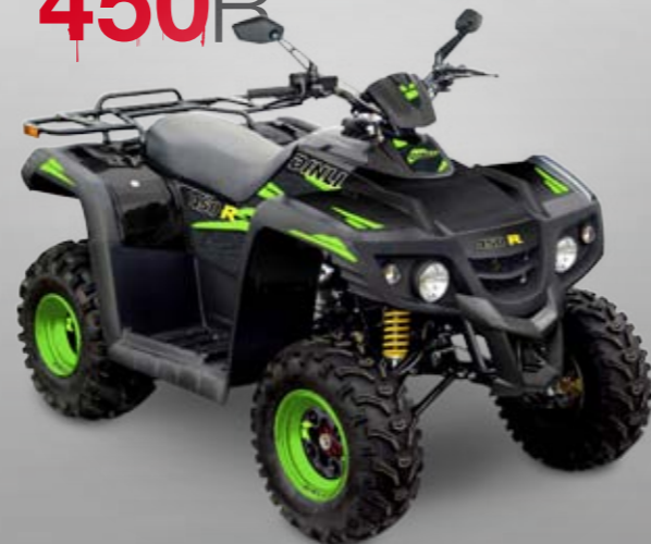
DINLI 450 R