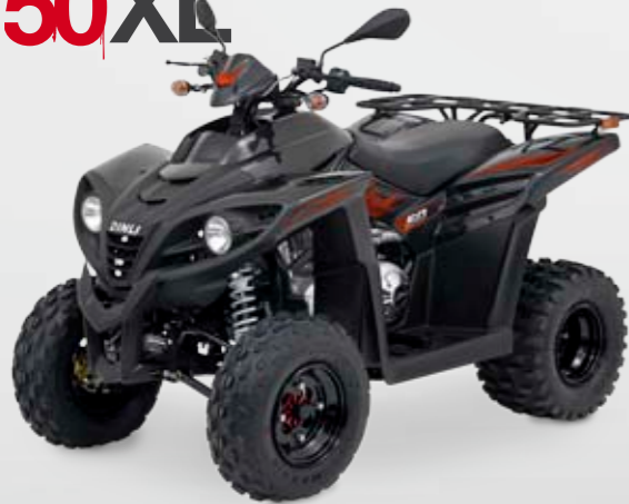
DINLI 50 XL