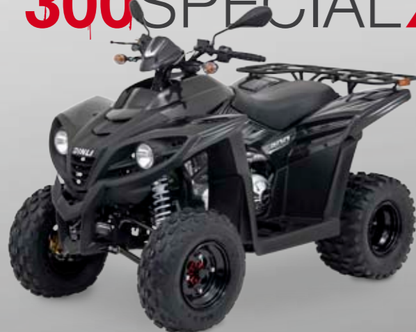
DINLI 300 SPECIAL X