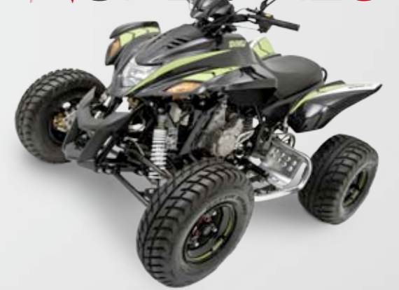
DINLI 450 SPECIALS