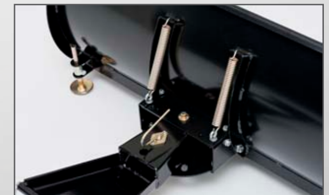
KEHRMASCHINE DINLI CENTHOR 700 / 800 L / EVO

inkl. UNTERBAURAHMEN 140 CM , 5-FACH VERSTELLBAR, GUMMILIPPE