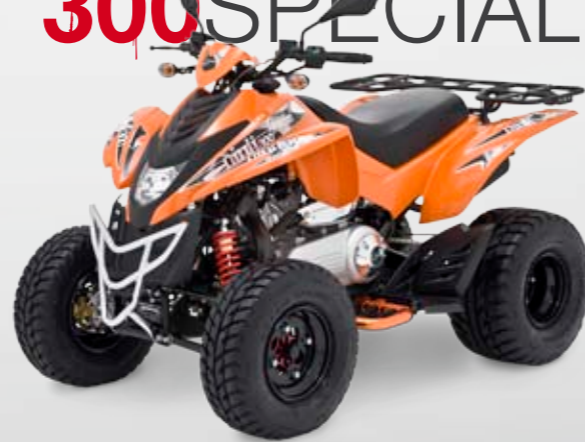
DINLI 300 SPECIAL