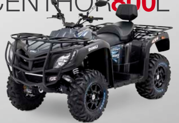
DINLI CENTHOR 800L