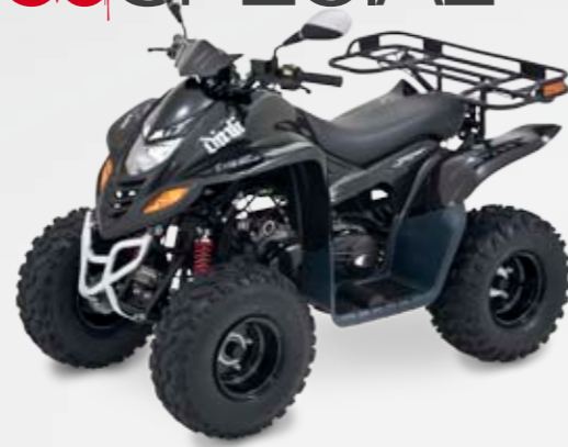
DINLI 50 SPECIAL