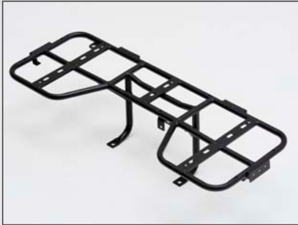
GEPÄCKTRÄGER HINTEN DINLI 800 EVO