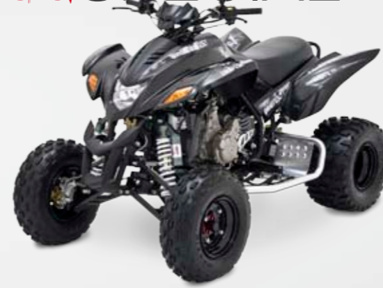
DINLI 450 SPECIAL