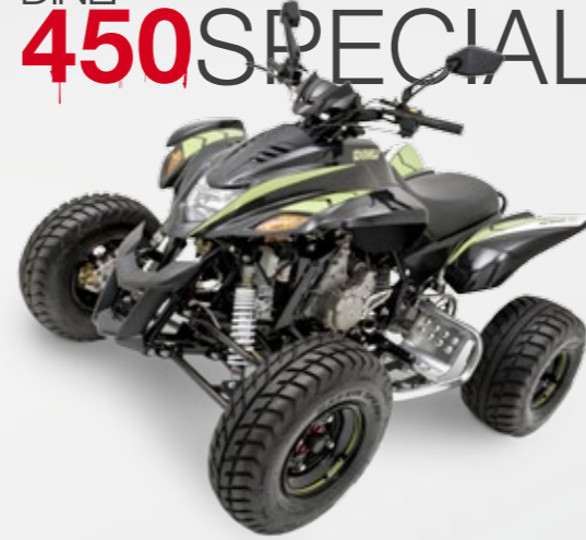
DINLI 450 SPECIAL S