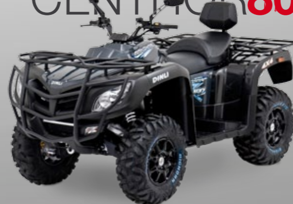
DINLI CENTHOR 800 L