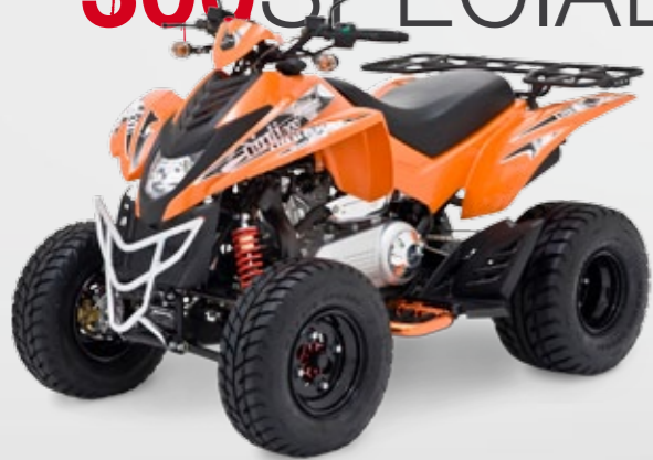
DINLI 300 SPECIAL