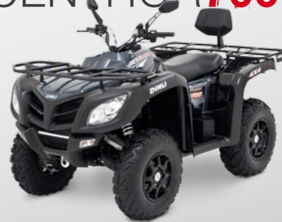
DINLI CENTHOR 700