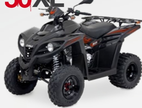
DINLI 50 XL