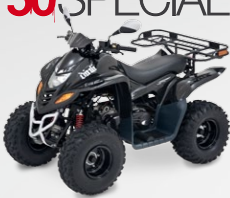
DINLI 50 SPECIAL