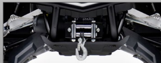
SEILWINDE MIT NYLONSEIL