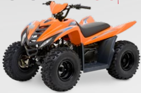
DINLI COBIA 50