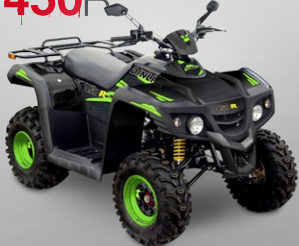
DINLI 450 R