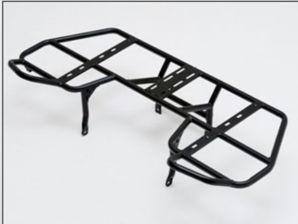
GEPÄCKTRÄGER VORNE DINLI 800 EVO