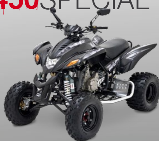
DINLI 450 SPECIAL