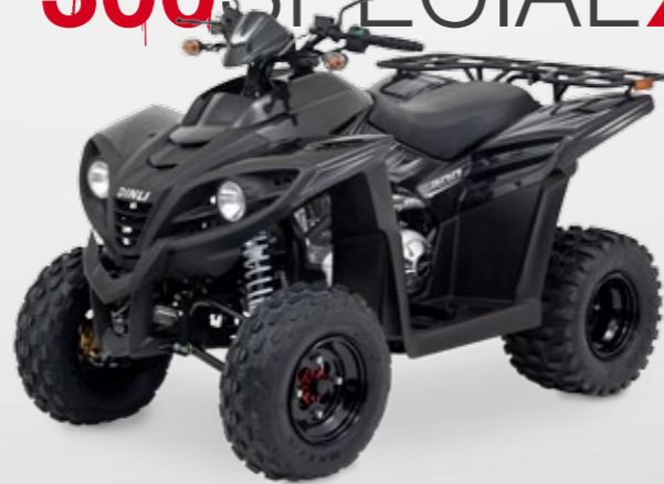
DINLI 300 SPECIAL X